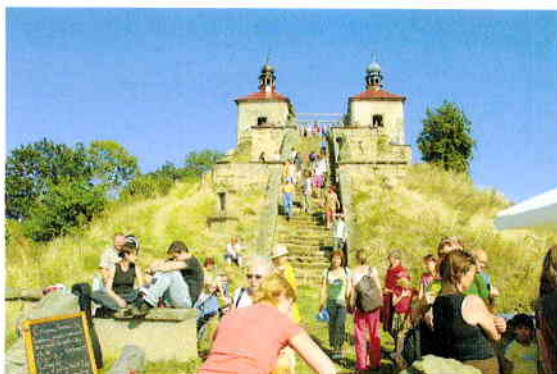
NA SCHODECH 30.8.2008