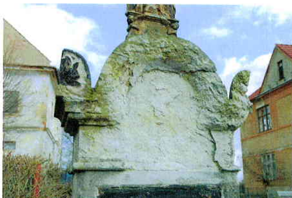
3/ Rašovice - detail poškozené hlavice