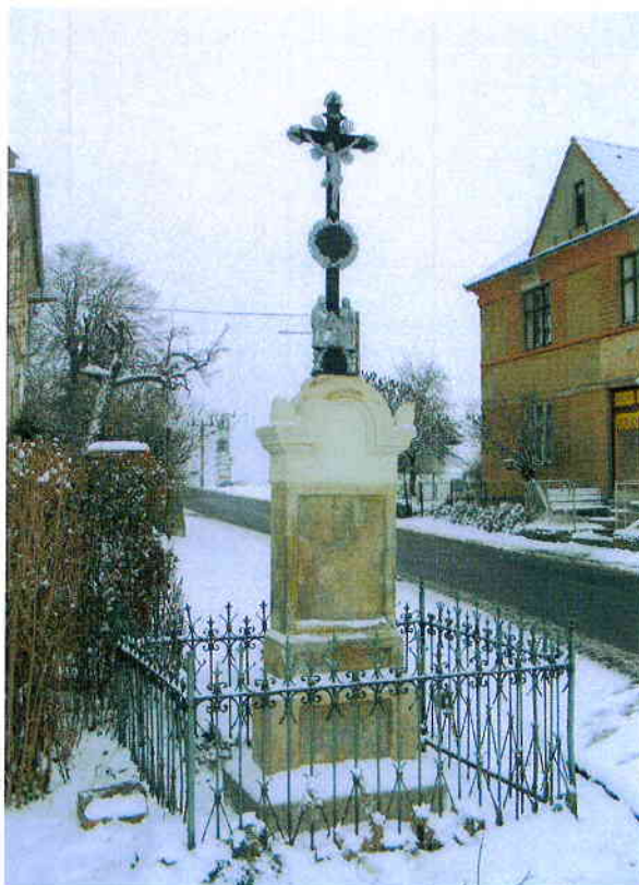
2/ .... a po celkové obnově