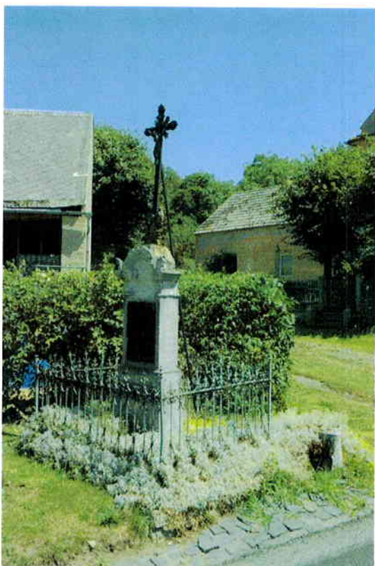
1/ Rašovice před rekonstrukcí