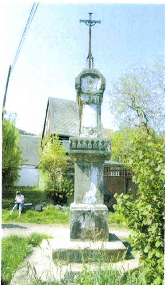
1/ Stav před zahájením prací